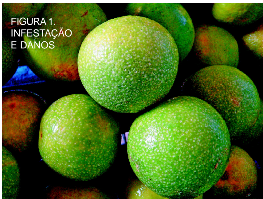
FIGURA 1. INFESTAÇÃO E DANOS

Em fevereiro/março de 2008, a presença de uniformes manchas circulares esbranquiçadas (1-3 mm de diâmetro) foram observadas em folhas e frutos de “Tahiti” e “Galeguinho” limoeiros (Fig. 1) de pequenas explorações agrícolas e domiciliares pomares em áreas urbanas do município de Boa Vista, Roraima. Na maioria das vezes as manchas foram observadas em frutos e na superfície superior das folhas. Esta espécie, citada na literatura como Ácaro hindu dos citros foi descrito a partir de Coimbatore, no sul da Índia. Por quase 80 anos após sua descrição, S. hindustanicus era conhecido apenas da Índia, até que sua ocorrência foi realçada em Zulia, no noroeste Venezuela. Não há registros